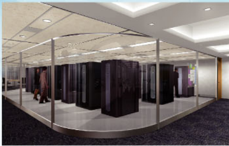
计算机房、通信机器室、图书馆、资料室等