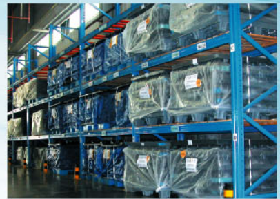
仓库、大厅等大空间