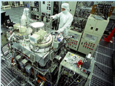
无尘室、半导体工厂等