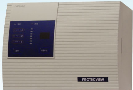
吸气式感烟火灾探测器PROTECVIEW®